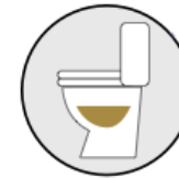
Dark urine & light stool