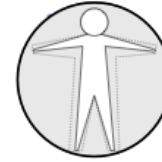
Unintended Weight Loss