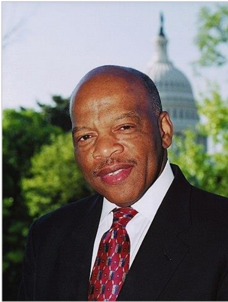
Congresista John Lewis