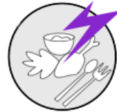
Pain After Eating