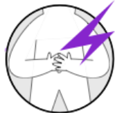
Lower Abdomen Pain